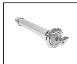
Horizontal de recesso F1 (Sob Consulta)