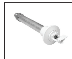
Horizontal (Sob Consulta)