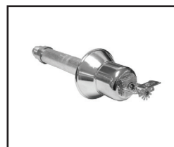
Horizontal/HB (Sob Consulta)