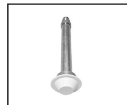
Embutido (Sob Consulta)