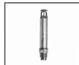
Upright (Sob Consulta)