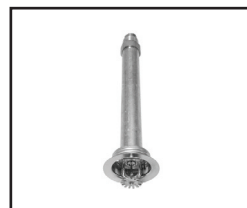
Pendente de recesso FP (Sob Consulta)