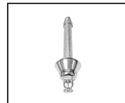
Pendente/HB (Sob Consulta)