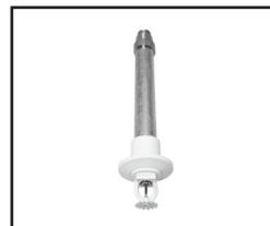
Pendente (Ver figura 1)

6. Disponível com classificação de pressão de 250 psi (17,2 bar) listada na cULus para Dry Pendente e seletivas configurações "HSW" (Horizontal Side Wall). Outras aprovações são para 175 psi (12 bar).