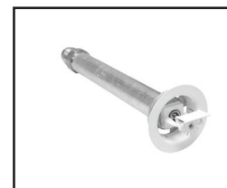
Horizontal de recesso (Sob Consulta)